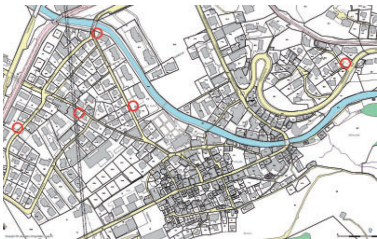
○ Standort Kehrichthäuschen

Vermietern von Ferienwohnungen wird empfohlen, den Feriengästen mindestens einen gebührenpflichtigen Kehrichtsack abzugeben.